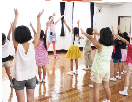
レッスン イメージ